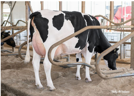
SILVERRIDGE V MARIUS EVICTION DAM