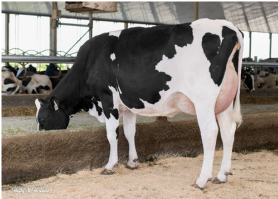
SILVERRIDGE V MARIUS EVICTION DAM